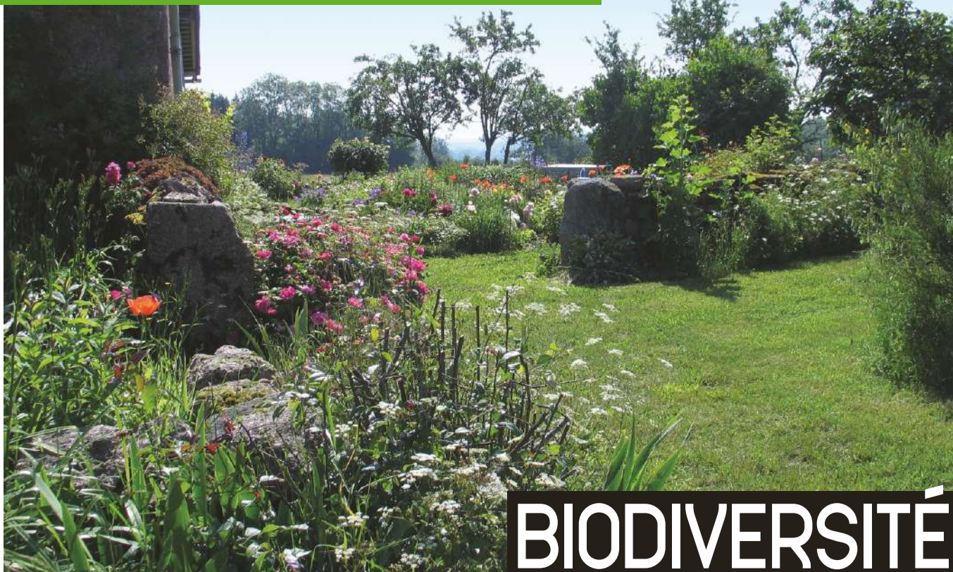
C. GAUMONT-NOË CONSERVATION