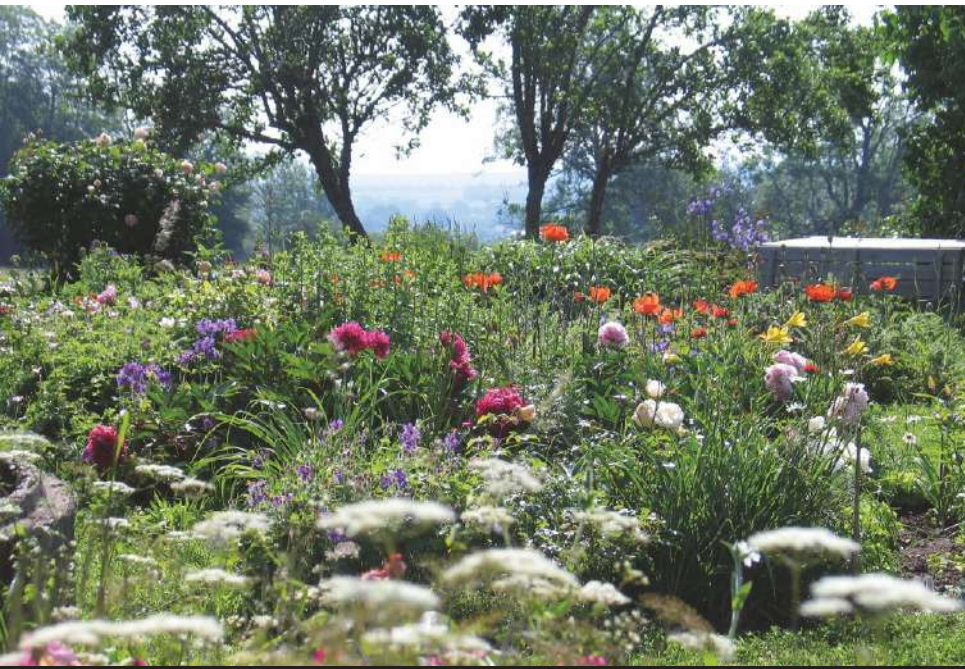
Il peut être judicieux de mélanger espèces sauvages et horticoles pour concilier l'esthétique, demandée par le client, et la biodiversité.