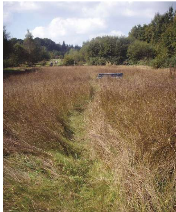
Le jardin en mouvement du lycée Jules-Rieffel de Saint-Herblain (44), inspiré du concept de Gilles Clément. Ce paysagiste de renom préconise de « faire avec la nature, le moins possible contre », en conservant par exemple les espèces ayant décidé du choix de leur emplacement.